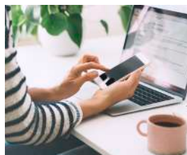
住戸・共用部 Wi-Fiサービス 雑誌読み放題サービス付き