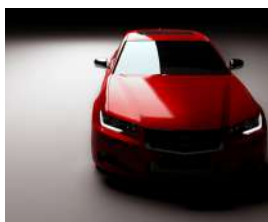
敷地内駐車場 134台確保