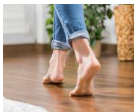
ガス温水式床暖房