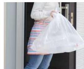
玄関扉前 ゴミ回収サービス