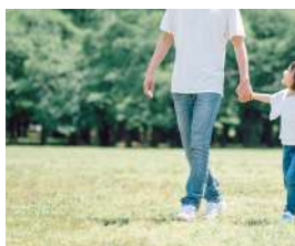
コミュニティを育む 造設公園隣接