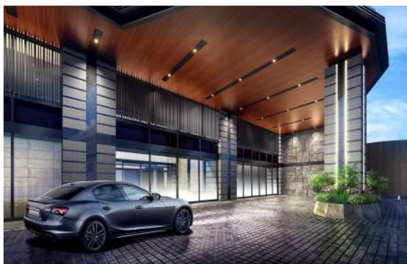
圧倒的な存在感を放つキャノピーと車寄せを配し、格調高く邸宅の顔を演出するアプローチ。