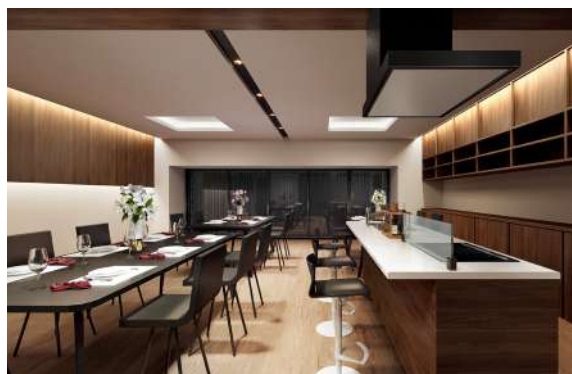
多彩に活用できるキッチン付きのコミュニティスペース。