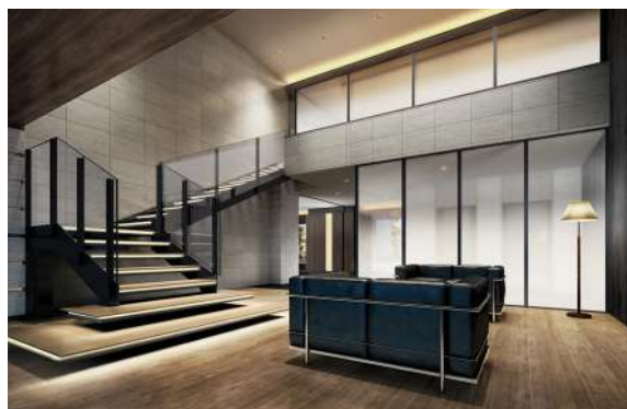
2層吹き抜けの空間に静謐の時間が満ちるグランドラウンジ。