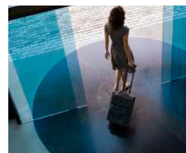
ハンズフリーキー採用