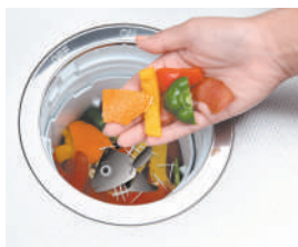
キッチン ディスポーザー