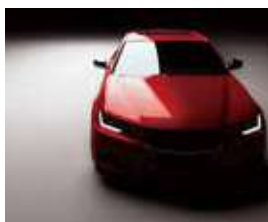
敷地内駐車場 134台確保