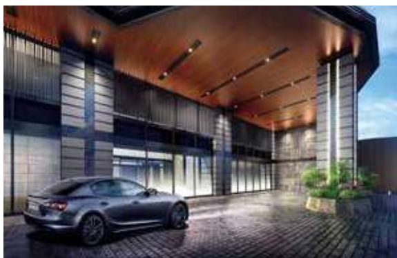
圧倒的な存在感を放つキャノピーと車寄せを配し、格調高く邸宅の顔を演出するアプローチ。