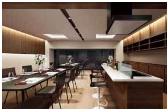
多彩に活用できるキッチン付きのコミュニティスペース。