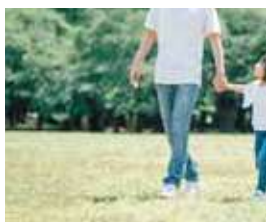
コミュニティを育む 造設公園隣接