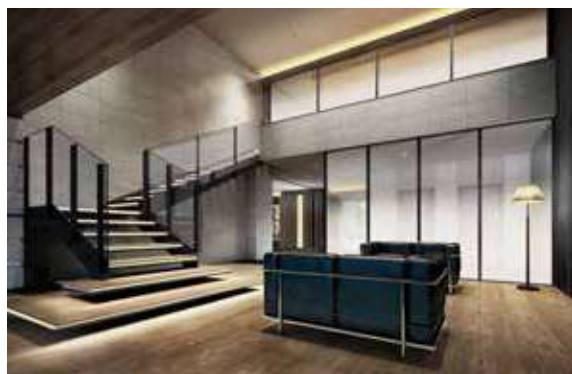
2層吹き抜けの空間に静謐の時間が満ちるグランドラウンジ。