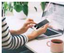
住戸・共用部 Wi-Fiサービス 雑誌読み放題サービス付き