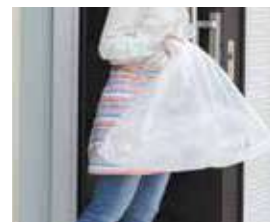
玄関扉前 ゴミ回収サービス