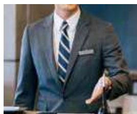
サービスカウンター