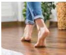
ガス温水式床暖房