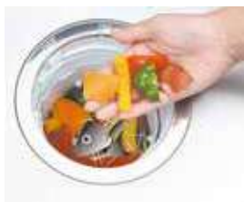
キッチン ディスポーザー