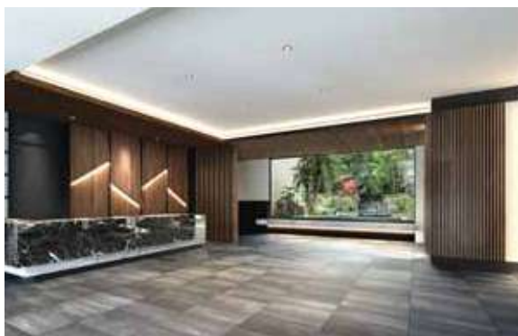
四季を通じて、エントランスに癒しをもたらすビューガーデン