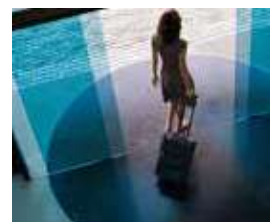
ハンズフリーキー採用